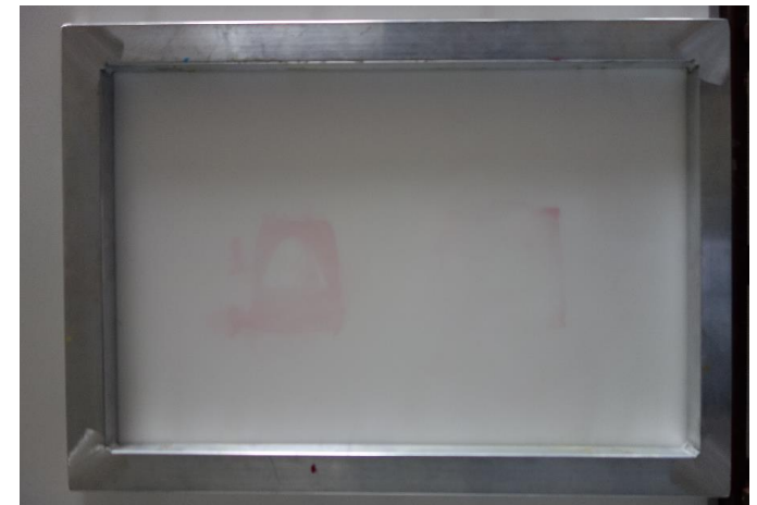
スクリーン専用枠