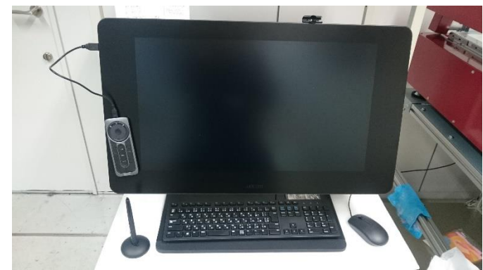
データ作成用液晶ペンタプレート