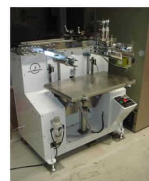
スクリーン印刷機（孔版式平面・曲面印刷機） (940円/時間)