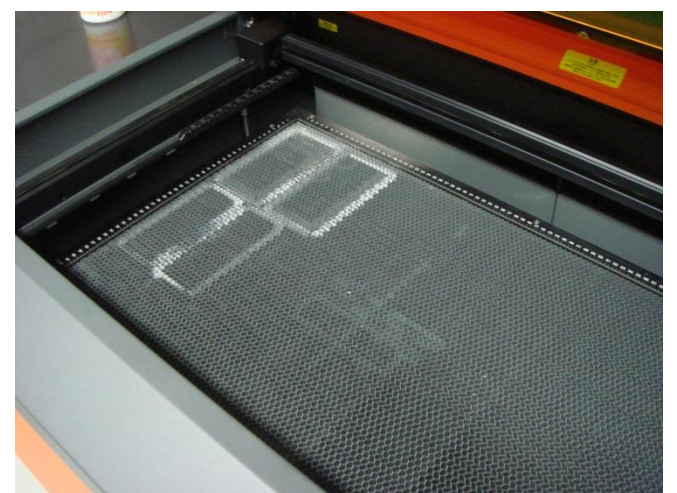
カッティング用ハニカムテーブル