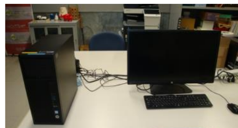
デザイン支援機器 (810円)