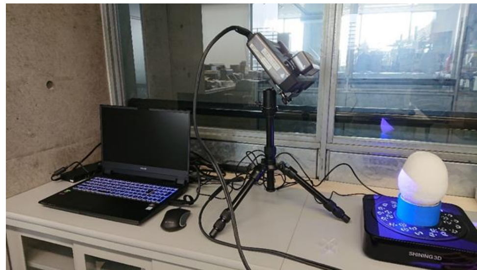
スキャナー本体と回転ステージ