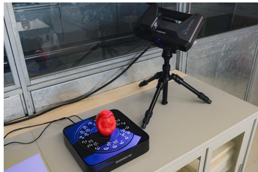
回転ステージでスキャンしているところ